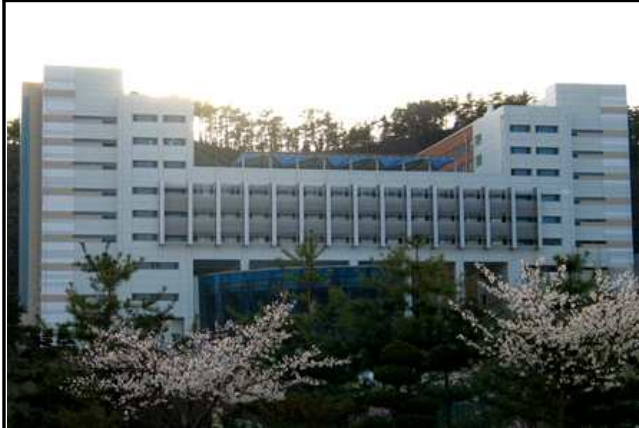
진리관(남/여, 3인실) 767,000원/1학기