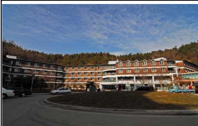
자유관(남, 2인실/3인실) 2인실: 765,000원/1학기 3인실: 621,000원/1학기