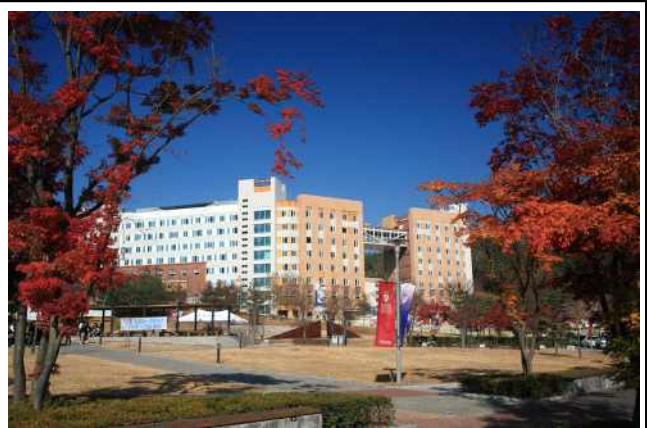
미래관(남/여, 2인실) 1,286,000원/1학기

※ 기숙사비(식비 미포함)는 2026학년도 기준이며 추후 변동될 수 있습니다. ※ 신입생 기숙사 신청기간 및 방법은 수시모집 합격자 발표 후 별도로 안내합니다.