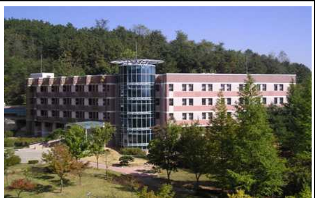
정의관(여, 2인실/4인실) 2인실: 904,000원/1학기 4인실: 705,000원/1학기